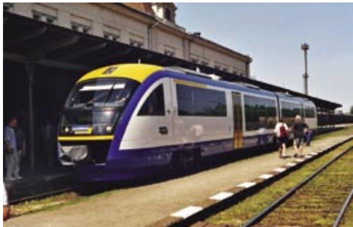
Pociąg kolei Lausitzbahn na stacji w Pilźnie