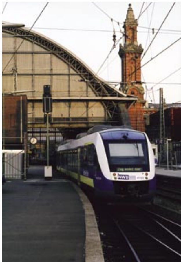
Bremen – pociąg VT523 (typ Coradia Lint 41 firmy Alstom) niemieckich kolei prywatnych NWB (24.04.2003 r.)

Zmiana przewoźnika i dalsza jazda pociągów pod szyldem ČD na podstawie licencji ma związek z fenomenem prywatnych przewoźników. Jej strategia (chodzi o CD) jest założona na zakładaniu spółek „córek“ z tymi firmami, którym jeszcze się nie powiodło. Nawet w przypadku firmy Vogtlandbahn GmbH z która prowadzone są najdłuższe rozmowy. Powód ČD s.a do zakładania tych spółek jest prosty – ograniczyć wpływ nowych przewoźników dysponujących nowoczesnymi pojazdami do komunikacji regionalnej. Również przewoźnicy prywatni podchodzą do tego pragmatycznie, aby minimalizować wpływy ze strony unitarnej