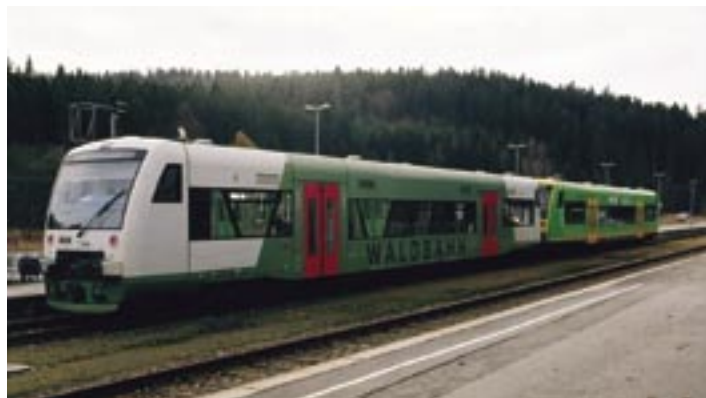
Pociągi prywatnego operatora WALDBahn, operującego na pograniczu czesko-niemieckim. Bayerische Eisenstein (23.11.2003 r.)