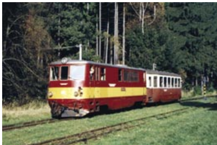
Lokomotywa 705.919 z jednym wagonem jako pociąg do Obratania. Strážovice (14.10.2001 r.)